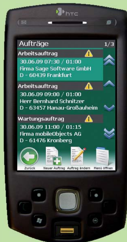
Endgerät für mobilen Kundenservice HTC P6500

Das Zusatzmodul mO – mobiler Kundenservice ermöglicht Ihnen und Ihren Mitarbeitern mit Hilfe spezieller Handys auch unterwegs auf Stammdaten und Aufträge im HWP zuzugreifen. Die Mitarbeiter können optimal gesteuert werden und sich per Navigationssoftware zum Kunden leiten lassen. Arbeiten lassen sich vor Ort dokumentieren, vom Kunden abzeichnen und per Knopfdruck an die Zentrale weiter leiten zwecks Rechnungsstellung.