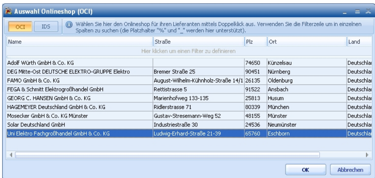
Abbildung: Auswahl der Großhandelswebshops über die OCI Schnittstelle

Unter funktionalen Gesichtspunkten unterscheiden sich die OCI und die IDS Schnittstelle wenig. In beiden Fällen öffnen Sie direkt aus dem Angebot heraus den Online Webshop des von Ihnen gewählten Großhändlers. Dort stellen Sie Ihren persönlichen Warenkorb zusammen, bestellen die Waren und übernehmen den Warenkorb in Ihr Angebot. Zur Kalkulation wird automatisch der aktuelle Einkaufspreis verwendet.