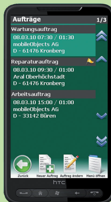
Endgerät für mobilen Kundenservice HTC HD2

Das Zusatzmodul mO – mobiler Kundenservice ermöglicht Ihnen und Ihren Mitarbeitern mit Hilfe spezieller Handys auch unterwegs auf Stammdaten und Aufträge im HWP zuzugreifen. Die Mitarbeiter können optimal gesteuert werden und sich per Navigationssoftware zum Kunden leiten lassen. Arbeiten lassen sich vor Ort dokumentieren, vom Kunden abzeichnen und per Knopfdruck an die Zentrale weiter leiten zwecks Rechnungsstellung.